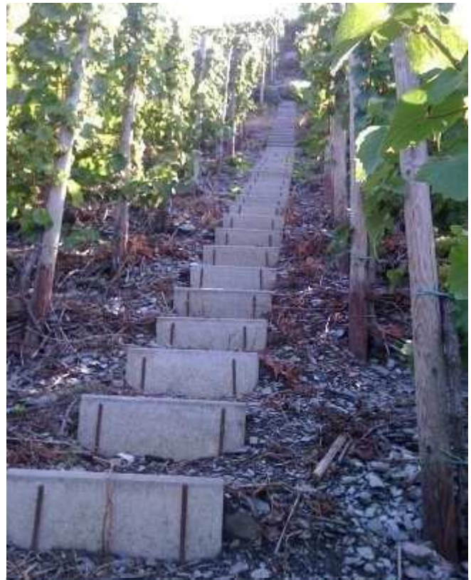
上圖：葡萄田間的砂礫土壤，可見略帶灰藍。